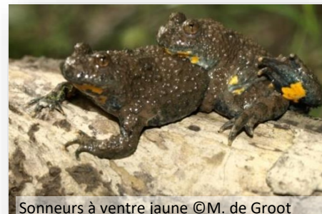
Sonneurs à ventre jaune

Le site abrite une biodiversité remarquable : de nombreux oiseaux d'intérêt comme le grand-duc d'Europe qui niche dans la falaise surplombant le site ; le guêpier d'Europe autrefois nicheur sur le site et pour lequel des travaux de restauration d'un milieu favorable à sa nidification ont été réalisés ; mais aussi de nombreux amphibiens comme le Crapaud calamite dont la présence n'est connue que dans trois stations en Haute-Savoie ; ou encore le Sonneur à ventre jaune d'intérêt européen, avec ses pupilles en forme de cœur. De nombreuses espèces de plantes remarquables dont certaines protégées sont également présentes.