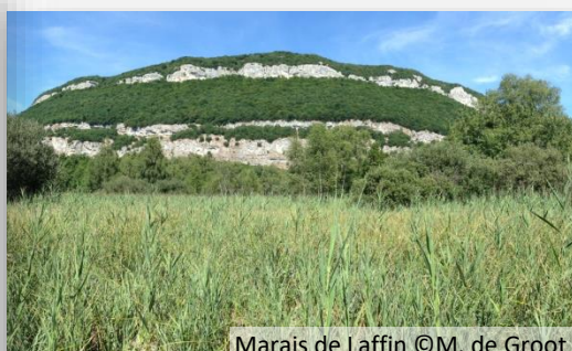
Marais de Laffin