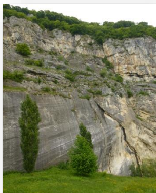
Miroir de faille