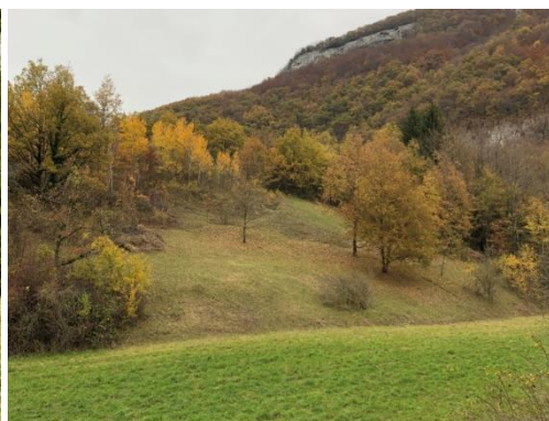
Coteaux des Vignes St Martin avant et après travaux