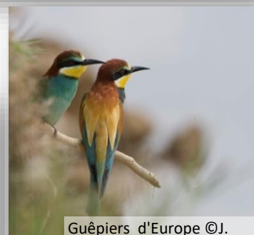
Guêpiers d'Europe

Cette richesse était cependant menacée par la fermeture du milieu par les arbustes et la fréquentation d'engins motorisés non autorisés. C'est pourquoi la mise en place d'une gestion adaptée était nécessaire. Celle-ci ne pouvait être effective qu'avec le concours des propriétaires . La convention d'usage que certains d'entre vous ont signée a été la première étape permettant l'application des mesures de gestion et, de fait, la préservation du patrimoine exceptionnel du site. Grâce à ces conventions, de nombreux travaux de restauration ont pu être réalisés depuis 5 ans, en voici quelques exemples.