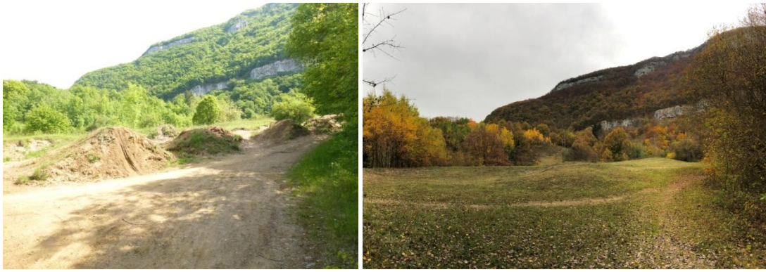
Pelouse sèche des Vignes St Martin avant et après arasement des tremplins de VTT et moto et végétalisation